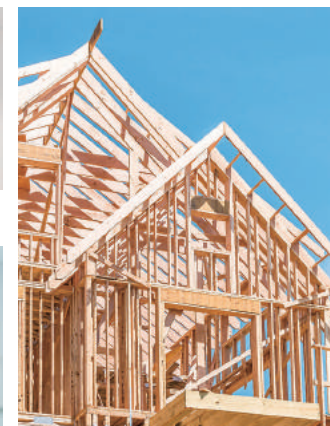
新築・増築・改築工事 など